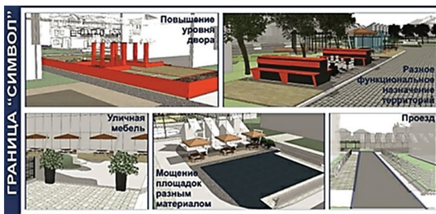
Рисунок 4 – Граница-символ Возможные архитектурно-планировочные приемы решения визуально прозрачных, и физически легко преодолимых границ в дворовых территориях (эскиз Е.Г. Апциаури)

террасной доской территория может быть использована как место для общения, наблюдения и релаксации на солнце.