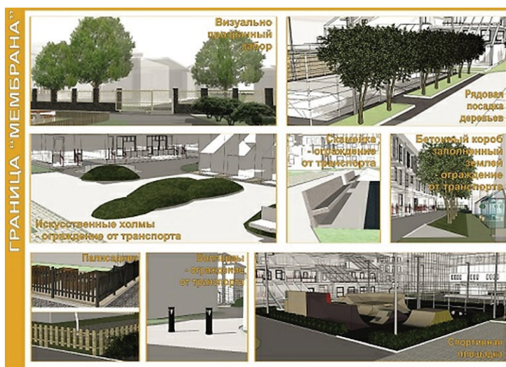
Рисунок 3 – Граница-мембрана. Возможные архитектурно-планировочные приемы решения визуально прозрачных, но физически условно преодолимых границ в дворовых территориях (эскиз Е.Г. Апциаури)

рольны родителям и чувствуют себя в безопасности. Организованные на территории двора проезды и парковки могут стать источником опасности. Важнейшей задачей благоустройства двора становится создание барьеров безопасности, ограждающих играющих детей от автотранспорта. Места игровых зон достаточно выделить границами-мембранами в виде скамеек, незначительных перепадов рельефа, столбов-боллардов, столбов-светильников, которые станут препятствием для въезда на площадки транспортного средства.