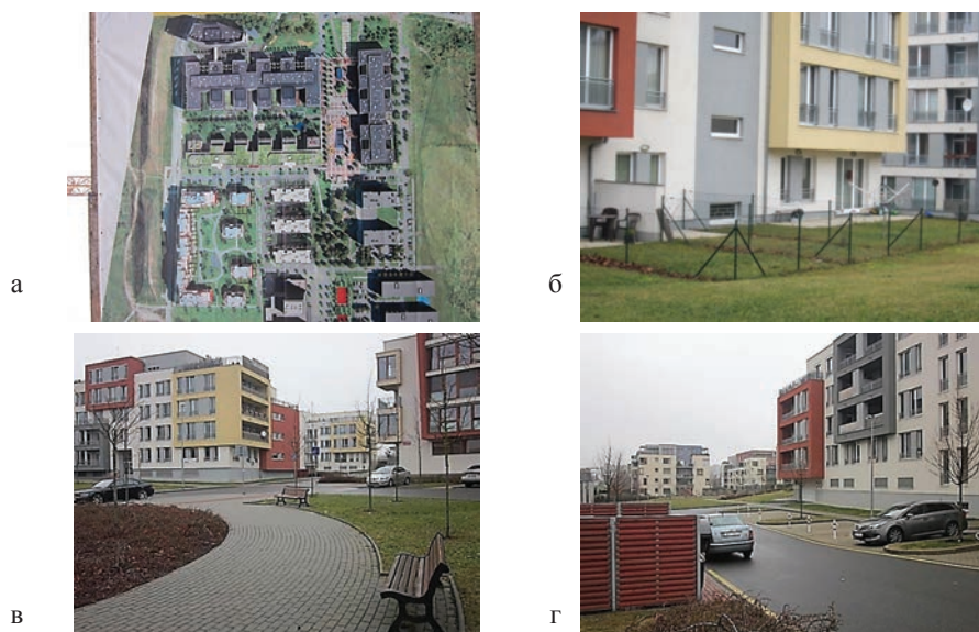
Рисунок 1 – Жилой комплекс Прага-13. Реализация принципа “полуприватные дворики в секционном жилье”: а – план жилого образования секционного типа, б – полуприватные дворики при квартирах 0-го этажа, в – дворовое пространство, предназначенное для пеших прогулок, г – междворовый проезд с хозяйственными площадками и гостевыми парковками.

и ясной пространственной организацией территории. Социологические исследования показывают, что на территориях, где есть четкое разграничение на сферы влияния конкретных групп населения, резко снижается вандализм по отношению к среде со стороны ее обитателей и посторонних, не живущих в этом дворе [4]. Те же закономерности прослеживаются и в зарубежной практике строительства. Исследования, проведенные в Дании и Канаде, показывают, что жильцы при выборе места жительства предпочтение отдают жилью с открытыми приквартирными двориками, предпочитая их таким же по стоимости арендной платы домам без палисадников [5, р. 95].