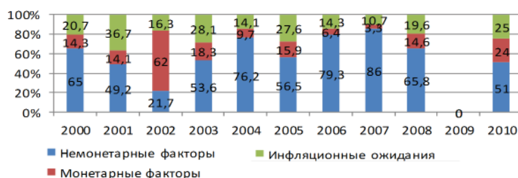
Рисунок 2 – Факторы инфляции в Кыргызской Республике 1 .

прочно укрепились сомнения относительно реальности оценок темпа инфляции. Статистическим комитетом и Национальным банком. Некоторые исследователи считают, что предлагаемые темпы инфляции являются заниженными; во-вторых, сопоставление целевых и фактических показателей инфляции зачастую расходятся в пользу преобладания последних. Так, согласно заявлению НБКР о “Денежно-кредитной политике на 2010 год”, в качестве целевого параметра был установлен показатель инфляции на уровне 7,5–9,5 %, фактически прирост потребительских цен составил 19,2 % 2 . Аналогичная ситуация складывалась в 2007 г., когда прирост индекса цен должен был составить 5–6 %, однако фактический уровень инфляции сложился в размере 20,1 % 3 , 2005 г. не явился исключением, при планируемом показателе в размере 4,0 %, фактический прирост цен составил 4,9 % 4 .