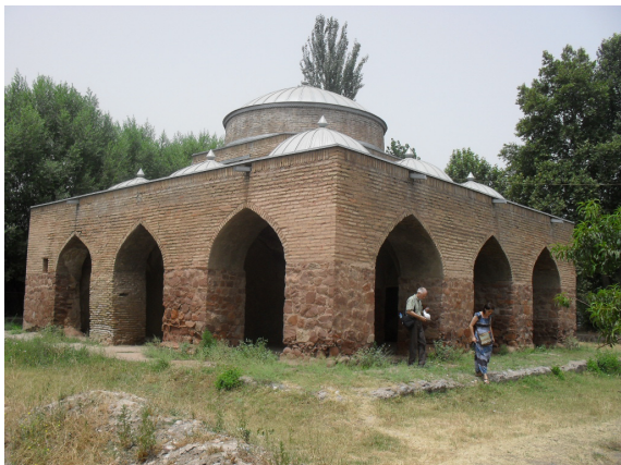
Рисунок 2 – Гиссарский заповедник. Мечеть Сангин. Фото 2011 г.

объема центрально-купольной системы и сводчатой галереи, что позволило препятствовать дальнейшему “расползанию” деформационных блоков (рисунок 2).