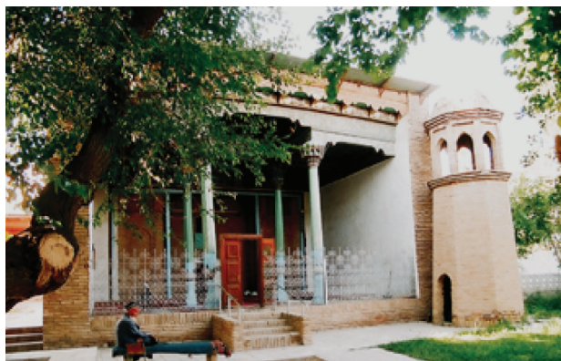
Рисунок 3 – Мазар Бобо-Таго в Истаравшане. Фото 2010 г.

В то же время можно попытаться в самом общем виде определить рациональные области применения каждого из методов восстановления