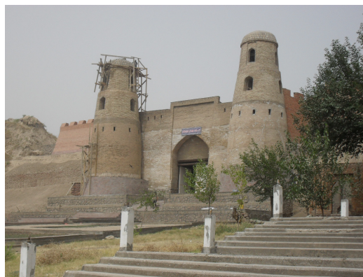
Рисунок 4 – Ворота Гиссарского арка. Фото 2011 г.