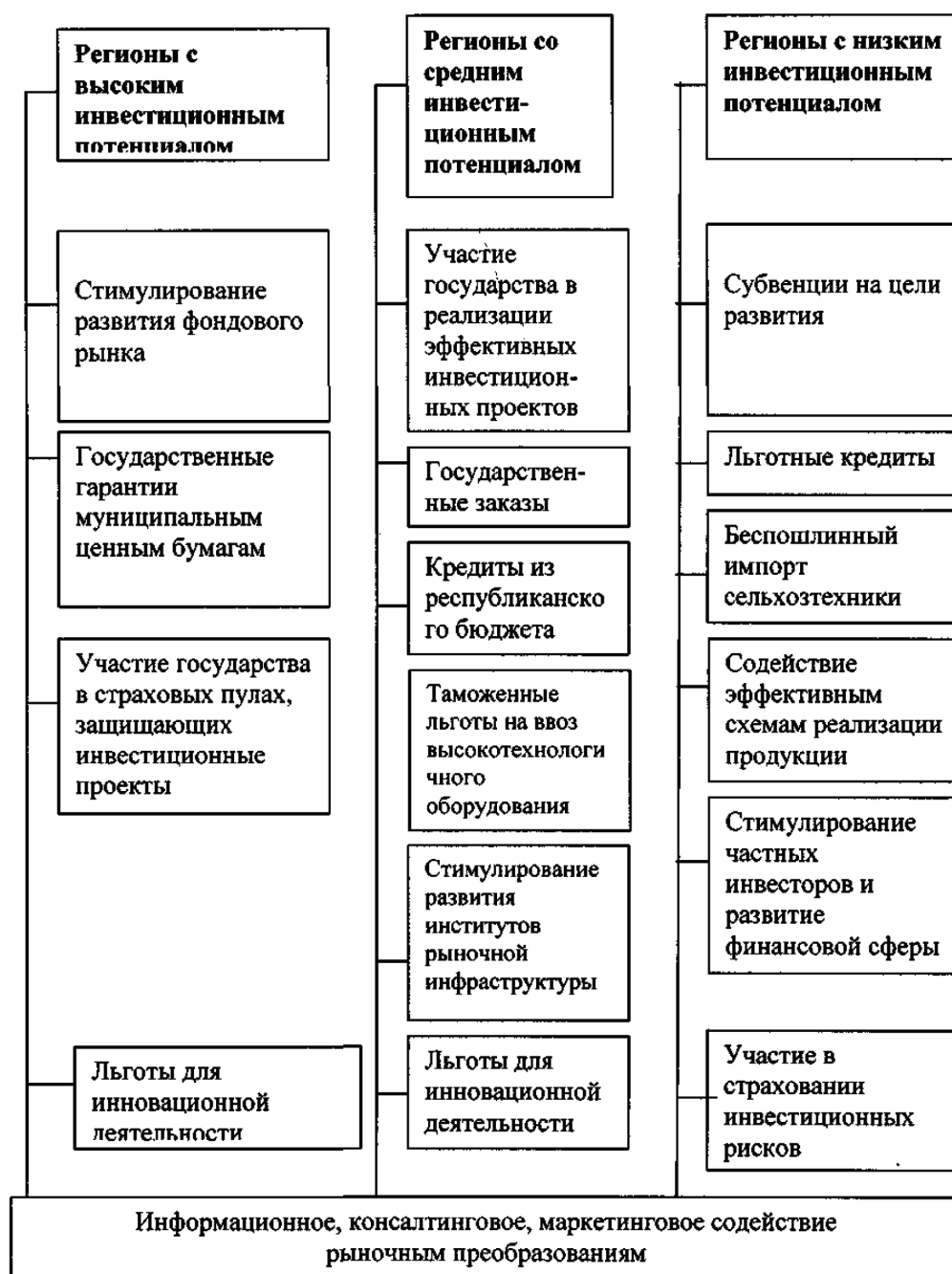
Рисунок 2 – Группировка регионов КР по инвестиционному потенциалу и активизации инвестиционных процессов

В условиях транзитной экономики, характеризующейся не только рыночными преобразованиями в регионах, но и кризисными явлениями, рыночные методы не могут обеспечить самоактивизацию инвестиционных процессов и, как