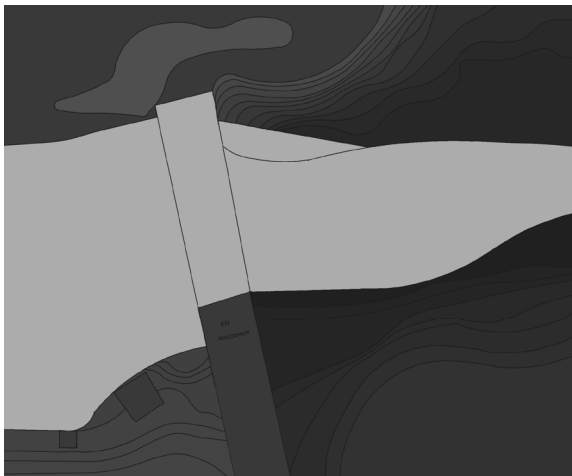
Рисунок 3 – Введение исходной информации с помощью специального программного комплекса в ПДСОМ [7]

Промышленное и гражданское строительство. 2007. № 10. С. 33–34.