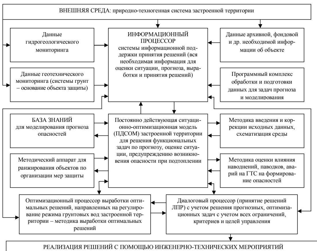
Рисунок 1 – Схема взаимосвязей элементов в системе поддержки принятия решений, направленных на предупреждение чрезвычайных ситуаций при подтоплении

личаются по водопотреблению и потерям воды из водонесущих коммуникаций (промышленные зоны, селитебные, лесопарковые зоны); учитываются плотины, водохранилища, реки, каналы. Одним из целевых назначений ПДСОМ является определение фактического и прогнозного показателя подтопленности объекта техносферы и застроенной территории в целом. Для определения показателя потенциальной подтопленности объекта требуется рассчитать прогнозное положение уровня грунтовых вод (УГВ) в результате действия источников подтопления (подпор от водоема, постоянные и аварийные утечки и т. д.). Для расчета прогнозного положения УГВ разработан авторский программно-вычислительный комплекс, составляющий содержание ПДСОМ, в основе которого математическое моделирование процесса геофильтрации. На ПДСОМ осуществляется также прогноз развития наведенных подтоплением опасных процессов. Карты районирования застроенной территории по потен-