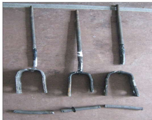
Рисунок 2 – Общий вид испытаний и характер потери несущей способности подвесок свода стекловаренной печи

соответствует техническим характеристикам применяемой стали 12Х18Н9Т.