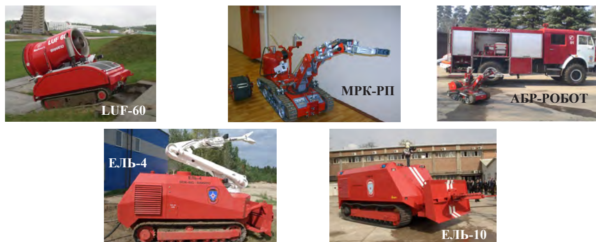
Рисунок 2– Общий вид пожарных РТС, находящихся на оснащении ВНИИ ПО МЧС России