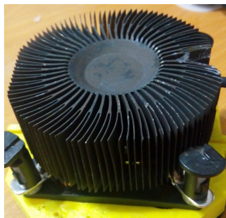
Рисунок 2 – Радиатор после нанесения оксидно-керамического покрытия