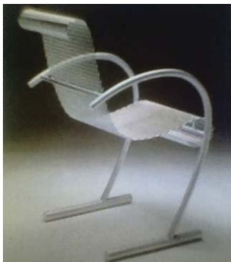
Рис. 1. Дизайн стула. Автор – Широ Куромато.