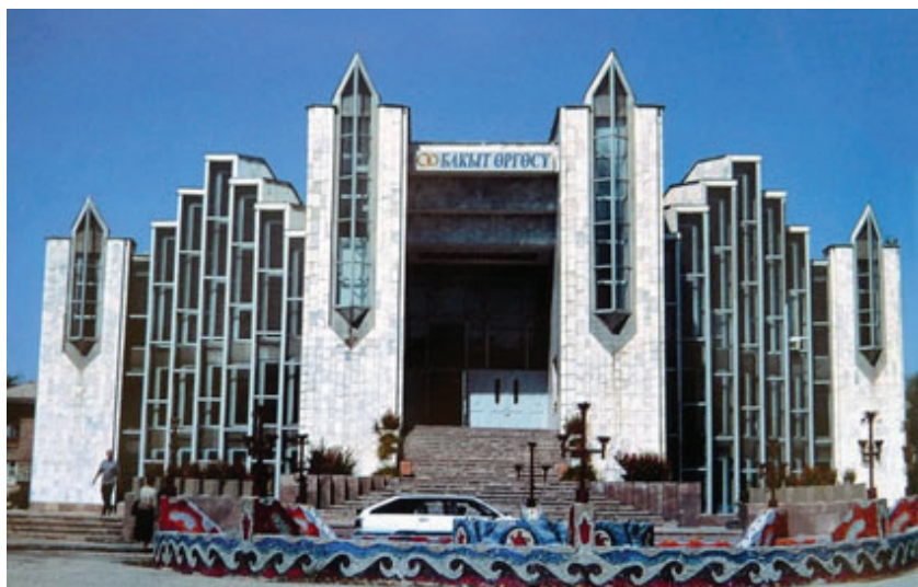
Рисунок 4 – Дворец бракосочетания