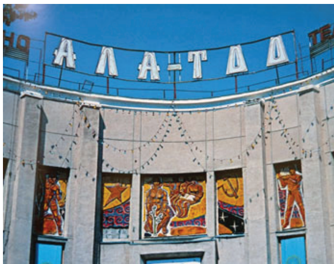
Рисунок 3 – Керамический рельеф

камнем. Они стремились включить в архитектурную конструкцию зданий элементы восточного зодчества (арочные очертания, внутренние дворики, купольный силуэт кочевой юрты). Чаще стали выполняться проекты ансамблевого строительства, включающие и оформительские работы по созданию единого, архитектурно-художественного облика здания. Все это привело к необходимости большего сотрудничества зодчих и художников уже на стадии проекта. Стало более разнообразным и приспособленным к региональным условиям типовое проектирование жилых зон и массовых общественных зданий в городах и селах. В областных и районных центрах (г. Ош, Талас, Нарын, Каракол, Балыкчи и др.) появились уникальные здания театров, административных учреждений. Больше стали применять произведения монументального искусства, проводить комплексные работы по художественному оформлению архитектурных объектов и окружающей среды [3].