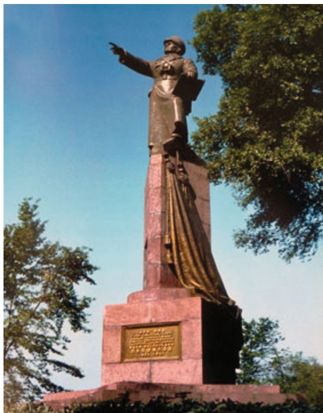
Рисунок 1 – Памятник И.В. Панфилову

Необычайно возросла творческая активность художников в оформлении городской среды после окончания Великой Отечественной войны. Это было связано с атмосферой общего подъема, живыми воспоминаниями участников войны. Среди монументальной пластики тех лет необходимо выделить памятник герою Советского Союза гвардии генерал-майору И.В. Панфилову (скульптор О.М. Мануйлова (рисунок 1).