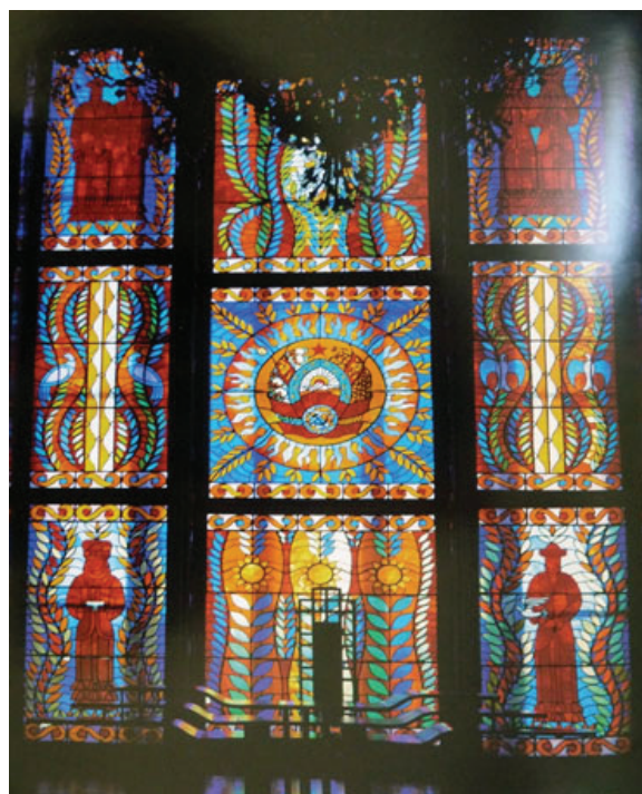
Рисунок 5 – Фрагмент витража