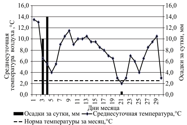
Рис.2. Месячный ход средних суточных температур воздуха и количества осадков в Бишкеке

По увлажнению ноябрь 2010 года в Чуйской долине оказался значительно более сухим, чем обычно. Всего за месяц выпало 16 мм (МС Токмак) до 24,5 мм (МС Бишкек) осадков (табл. 1, рис. 2), что составило только 42 – 66% от нормы. Осадки с количеством \geq 0,1 мм отмечались лишь в течение 2-3 дней.