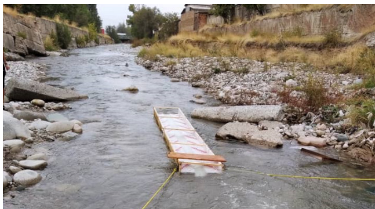
Рисунок 6 – Момент погружения экспериментального макета с помощью натянутых по берегам реки веревок и выбор места для проведения серии экспериментов