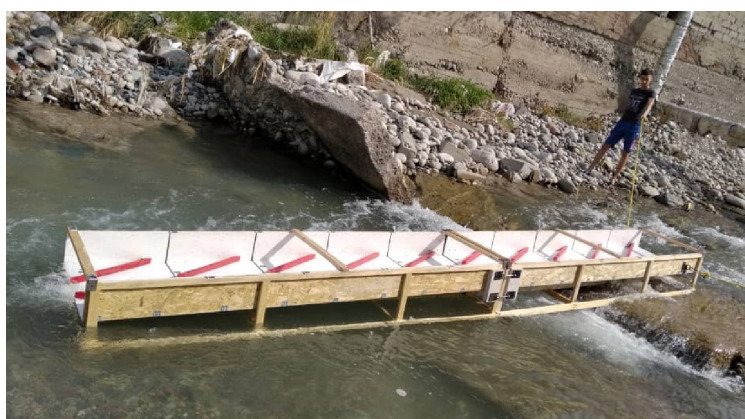
Рисунок 3 – Испытания на прогиб соединенных встык двух макетов. Один из них погружен в поток речной воды и удерживается с помощью натянутых по берегам веревок