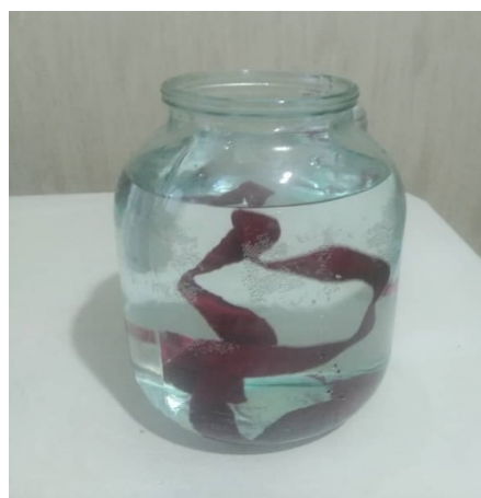
Рисунок 5 – Лента из 100 % хлопка, смоченная в воде. Видно, что погруженная лента находится на плаву