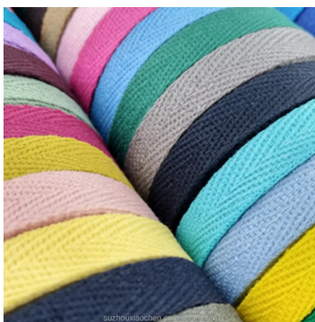
Рисунок 4 – Разноцветная плетеная лента – тесьма в елочку, из 100% хлопка, шириной 2 см

Момент погружения экспериментального макета показан на рисунке 6.