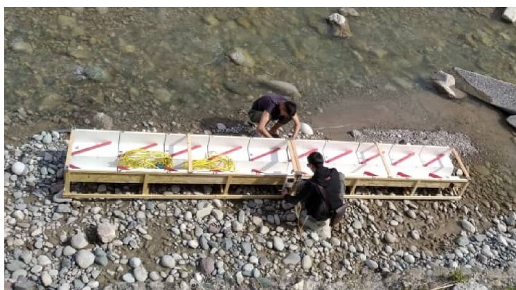
Рисунок 2 – Стыковка конструкций из двух частей экспериментального макета прямо на берегу реки, длиной 5 м