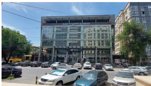
Рисунок 9 – Головной офис «Бай-Тушум», ул. Уметалиева 76, г. Бишкек