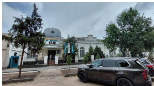
Рисунок 8 – Здание первого банка. Проспект Эркиндик, 59, г. Бишкек

Архитектура его была достаточно строга, лаконична, характерна стилю того времени, отдаленно напоминающая модерн. Ныне он реставрирован под новый банк (рисунок 8).