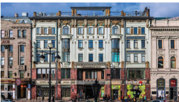
Рисунок 7 – Московский Купеческий банк