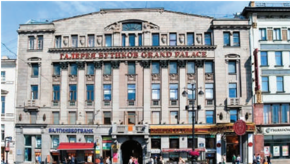
Рисунок 5 – Сибирский торговый банк