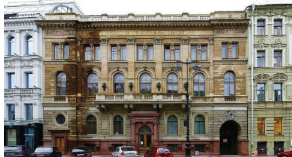
Рисунок 6 – Русский банк для внешней торговли