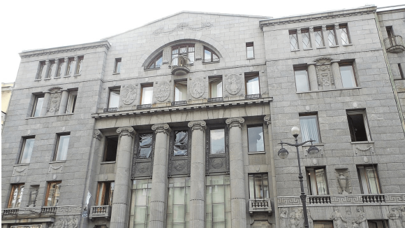
Рисунок 1 – Азовско-Донской коммерческий банк

Коммерческий банк «И.В. Юнкер и Ко» на Невском проспекте первоначально был конторой компании «Зингер», а в 1911 г. его выкупила компания «И.В. Юнкер и Ко» (рисунок 3). Здание было перестроено по проекту архитектора Вильгельм Ван дер Гюхта при участии Адольфа Эрихсона [4].