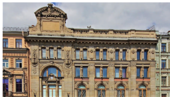
Рисунок 4 – Азовский коммерческий банк – Русско-Азиатский банк

Фасад с большими окнами-витринами был облицован красным гранитом, его украшали увенчанные статуями колонны. После революции здесь располагались книжный склад, универмаг, ателье. Сегодня в этом здании находится Генеральное консульство Франции в Санкт-Петербурге [4].