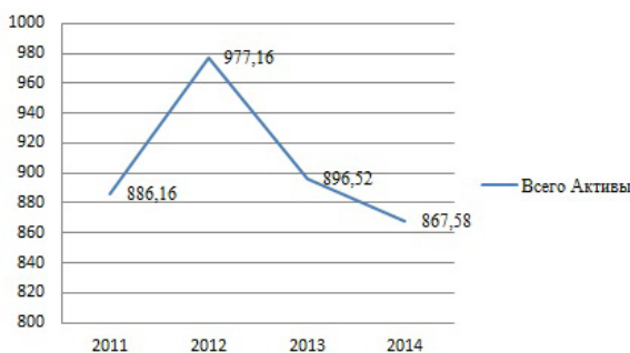
Рисунок 1 – Динамика индекса Херфиндаля – Хиршмана в 2011–2014 гг.

пень монополизации рынка по совокупным активам (рисунок 1), показывает, что в целом банковский рынок Кыргызской Республики является низко концентрированным.