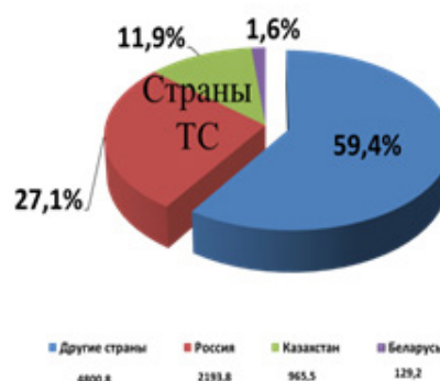
Рисунок 1 – Структура товарооборота КР со странами ТС [2]

40,7 %, в том числе в экспорте – 27,8 % (с учетом золота), 44 % (без учета золота) и импорте – 44,9 %. Самый большой удельный вес в товарообороте Кыргызской Республики занимает Российская Федерация – 27,1 %, далее Казахстан – 11,9 %, и на Беларусь приходится 1,6 % (рисунки 1, 2).