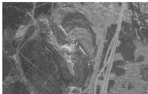
Рисунок 1 – План расположения профилей наблюдения на борту карьера со стороны лежачего бока месторождения

ранее методик просвечивания или томографии системами наблюдения и последующим методом интерпретации, основанном на концепции трех-этапной интерпретации [4]. В работах [5–7] описа-