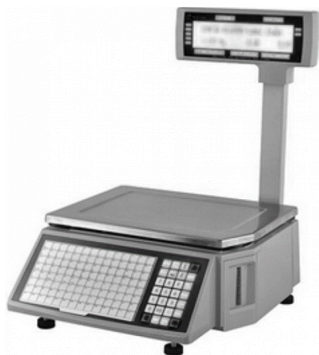
Рисунок 1 – Внешний вид весов Rongta RLS1100

Изначально оборудование от производителя невозможно связать со средой 1С, поэтому возникла необходимость разработки внешней