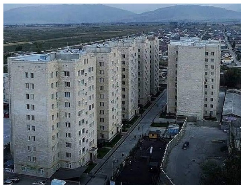
Рисунок 2 – Микрорайоны в южной части города Бишкек

о том, куда деваются отходы. Автор призывает решать эти проблемы с помощью современного способа переработки отходов с помощью биогазовых установок, закладывая их стоимость, монтаж при проектировании строительных объектов.