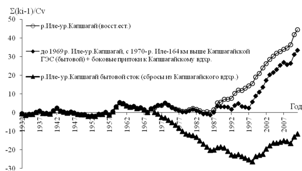
Рисунок 2 – Разностные интегральные совмещенные кривые естественного стока р. Или без влияния водохранилища Капшагайской ГЭС и наблюдаемого (бытового) стока этой реки за 1932–2011 гг.

Бытовой сток р. Или, измеряемый в нижнем бьефе плотины Капшагайской ГЭС в среднем за 1987–2011 гг. составил 488 \text{ м}^3/\text{с} или 11551 \text{ млн м}^3 в год, что на 106 \text{ м}^3/\text{с} или на 3345 \text{ млн м}^3 , т. е. на 17,8 \% меньше, чем его естественная величина за этот же период; а по сравнению с бытовым стоком (суммарным притоком воды в водохранилище) он оказался ниже на 76 \text{ м}^3/\text{с} или 2399 \text{ млн м}^3 .