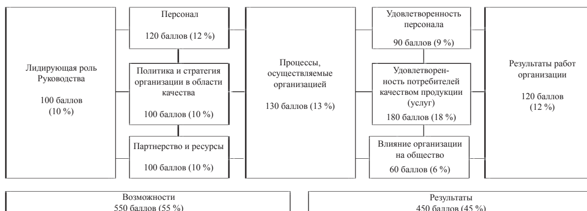
Рисунок 2 – Модель государственной премии в области качества Правительства Кыргызской Республики [4]

темного подхода к управлению качеством у отечественных производителей.