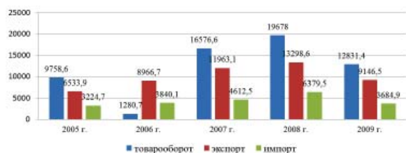
Рисунок 1 – Динамика внешней торговли Казахстана и России, млн долл. 1

протекания современного кризиса в России, Казахстане и Кыргызстане.