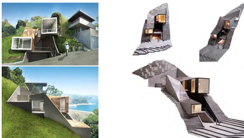
Рисунок 1 – Пример модульного строительства на склоне “Vail Grant Residence”

рушения материалов; рациональной передислокацией серийными видами автомобильного, железнодорожного, воздушного и водного транспорта; быстрым изменением объемно-планировочного решения в зависимости от динамики потребностей людей; наличием встроенного оборудования и мебели; возможностью монтажа без использования тяжелого кранового оборудования и вручную. В социальном плане это создает большие инновационные предпосылки для превращения статической и не изменяющейся искусственной среды обитания в новое, адаптирующееся и динамичное пространство (рисунок 1).