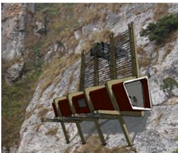
Рисунок 6 – Общий вид дома-гнезда “Eagle Nest Hut”

Строительство с применением контейнеров начиналось как творческий эксперимент. Сегодня все больше потребителей признают экономические и экологические преимущества их использования в новом качестве, и такие дома постепенно переходят в разряд привычных явлений для временного проживания. Из грузовых контейнеров различных размеров строят виллы и дачные домики, магазины и офисы, создают инсталляции и арт-объекты, используют в качестве мебели и деталей интерьера,