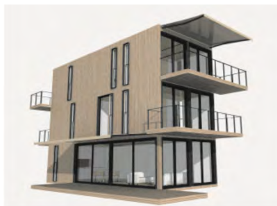
Рисунок 4 – Распространенные типы блокировки модулей по вертикали