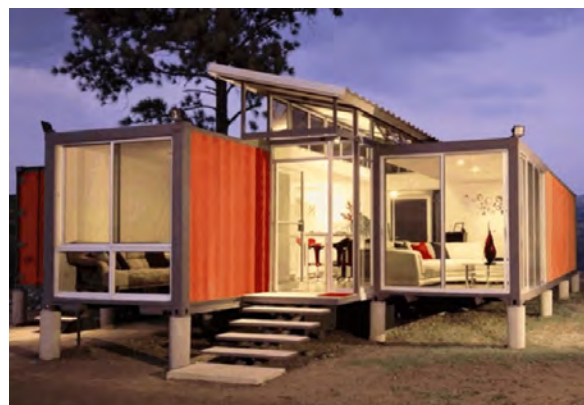
Рисунок 5 – Пример блокировки контейнеров по горизонтали с планировкой и решение фасадов в современном стиле

быть снабжен козырьком, элементами отделки фасада, чердаком или другими индивидуальными архитектурными элементами (рисунок 5).