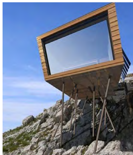
Рисунок 3 – Установка блок-контейнера на скалистый склон воздушным видом транспорта

легко демонтируются и перевозятся на другое место. Изготавливаются в различном исполнении для любых климатических условий, отвечают всем пожарным и санитарным требованиям. Основные типы модульных зданий: