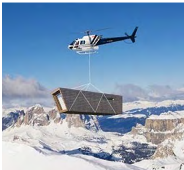
Рисунок 2 – Доставка блок-контейнера