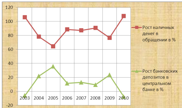
Рисунок 2 – Темпы роста наличных денег и депозитов банков КР за 2003–2010 гг.

в Кыргызской Республике почти не участвуют в процессе денежного предложения через многократное расширение депозитов. Это является одной из причин того, что глобальный финансовый кризис не коснулся Кыргызской Республики.