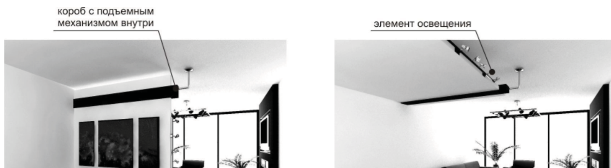
Рис. 3. Общий вид подъемной перегородки.