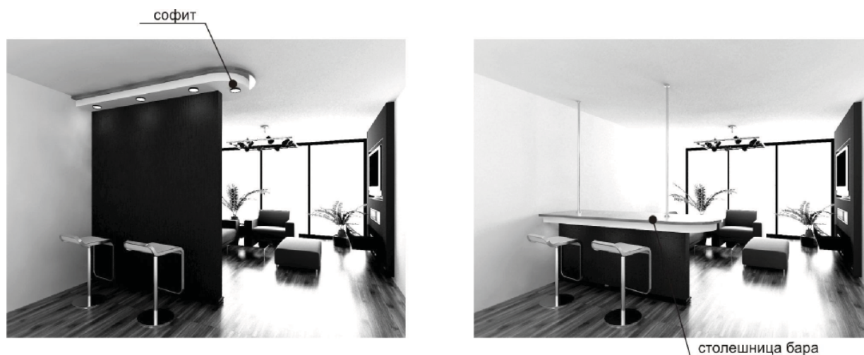
Рис. 4. Общий вид выдвжной перегородки.

терьера. Панели могут задвигаться в специально монтируемые ниши, требующие достаточно большого пространства. Ширина панели зависит от перекрываемого проема и количества створок в системе. Высота панели может достигать 3–3,5 м. Современный механизм трансформации сдвижной перегородки, прошедшей долгий путь развития, выдерживает нагрузку до 200 кг/м направляющей рельсы, что позволяет устанавливать перегородку из любого, даже самого тяжеловесного материала, и передвигать ее легким движением руки.