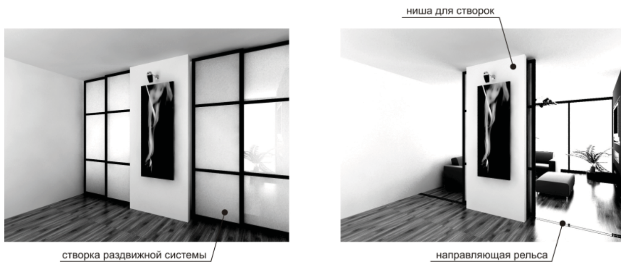
Рис. 1. Общий вид сдвижной перегородки.