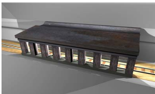
Рис. 2. 3D-модель галереи с трамплином [1].