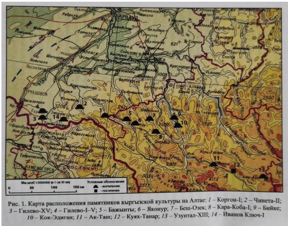
Рисунок 1 – Карта расположения памятников кыргызской культуры на Алтае