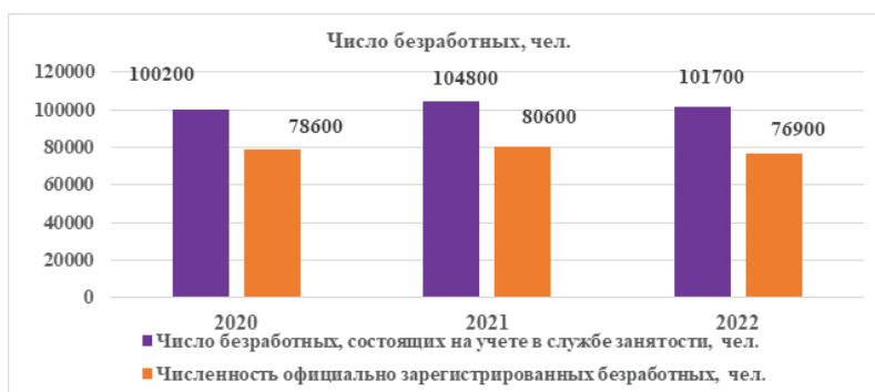
Рисунок 2 – Число безработных