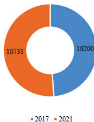
Рисунок 1 – Заработная плата одного сотрудника в сфере туризма

Также возросла и численность работников в сфере туризма. На 2021 год она составила 7,2 тыс. человек, наибольшее число из них занято в санаторно-курортных учреждениях, что составляет 23,6 % [2]. Кроме того, увеличилась и заработная плата сотрудников в сфере туризма (рисунок 1).