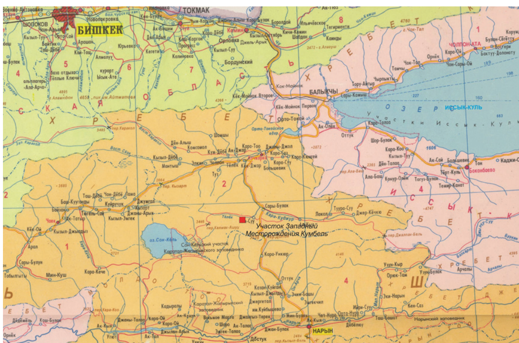
Рисунок 1 – Карта месторасположения участка Западный месторождения Кумбель

Вторая разновидность скарных образований – секущие жильные тела, установленные как в гранодиоритах, так и в породах кровли. Жильные скарны приурочены к разрывным нарушениям северо-восточного направления. Их мощность до 2 м, размер по простиранию – до 16 м. В породах кровли жильное скарное тело имеет мощность 10 м, прослеживается на 50 м севернее основной скарновой залежи (см. на чертеж № 2 – зона разлома северо-восточного простирания № 3). С глубиной мощность жильных скарнов сокращается до первых метров [3, 4].