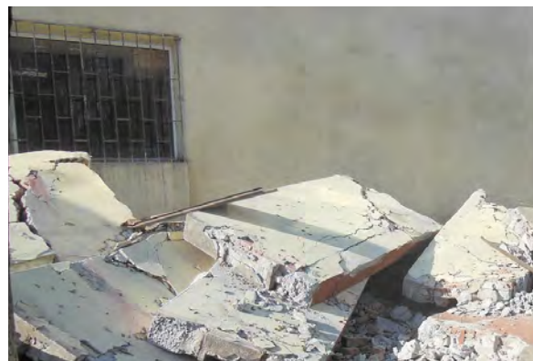
Рисунок 2 – Блоки перед зданием