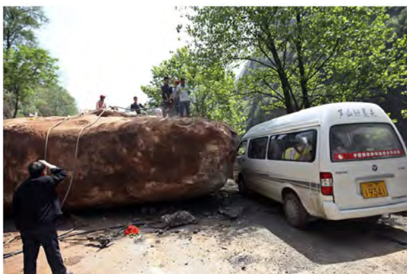
Рисунок 1 – Валун на дороге

В таких случаях авторы предлагают использовать специальные взрывные работы с помощью