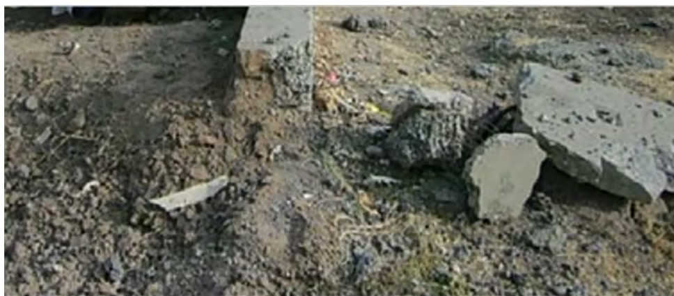
Рисунок 8 – Результаты взрыва 1 кг состава ФПА-1

Таким образом, результаты исследований и экспериментов показали возможность и большие перспективы использования низкоплотных взрывчатых смесей простейшего состава для взрывного разбора завалов при различных чрезвычайных ситуациях. Необходимо отметить, что при взрывном способе разбора завалов не существенна форма и масса перемещаемых блоков, а решающими факторами являются место (или места) размещения зарядов и их энергетические характеристики, которые при использовании ПВС могут варьироваться в очень широких пределах.