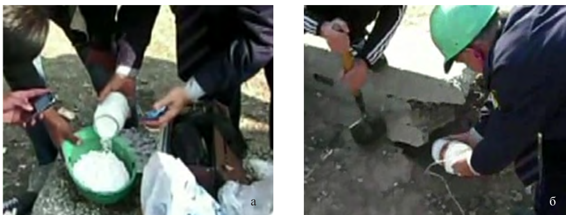
Рисунок 7 – Приготовление состава ФПА-1: а) подготовка заряда; б) Размещение заряда