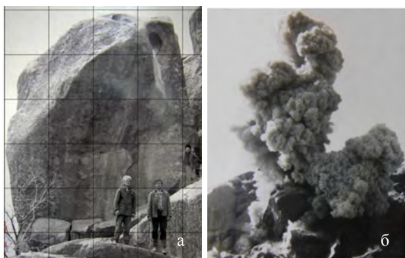
Рисунок 3 – Общий вид блока а) до взрыва; б) момент взрыва