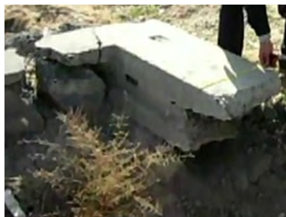
Рисунок 6 – Обмер блока

На следующем этапе исследований были проведены опытные взрывы для перемещения блоков