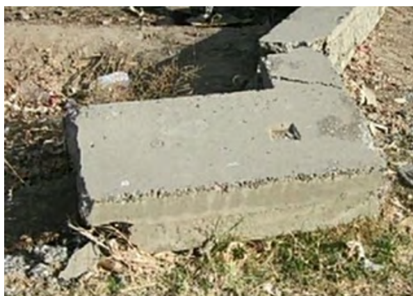
Рисунок 5 – Блок до взрыва