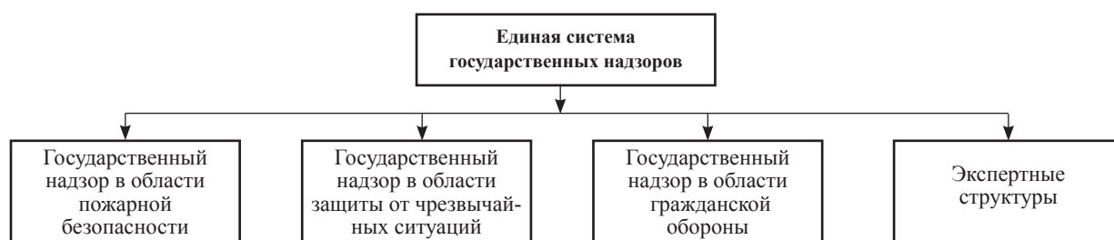
Рисунок 1 – Структура единой системы государственных надзоров

➤ подразделения, осуществляющие экспертную деятельность в области гражданской обороны, предупреждения чрезвычайных ситуаций природного и техногенного характера, обеспечения пожарной безопасности (экспертные структуры) [2]. Структура единой системы государственных надзоров МЧС России представлена на рисунке 1.