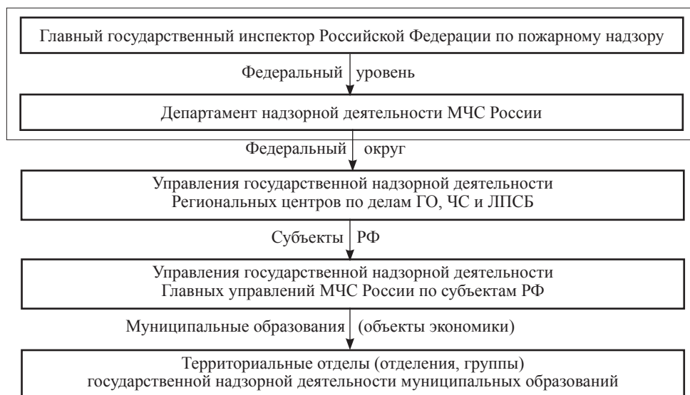
Рисунок 3 – Общая организационная вертикаль государственных органов Единой системы государственных надзоров