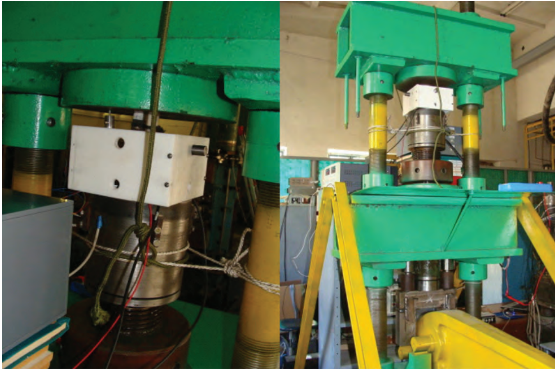
Рис.1. Испытательная машина.

ваны датчики LVDT фирмы Lucas Shaevitz двух типов – MHR 010 и MHR 050, обладающих диапазонами регистрируемых линейных перемещений – \pm 0,10'' \approx \pm 2,54 мм и \pm 0,05'' \approx \pm 1,27 мм соответственно [1, 2]. Такой набор аппаратуры для регистрации деформаций и нагрузок, однако, не обеспечивал требуемой точности и стабильности измерений.