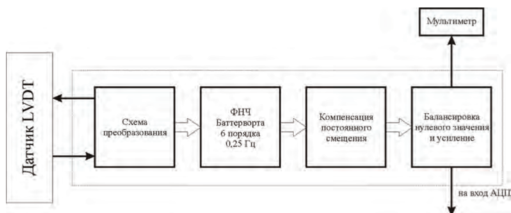
Рис. 2. Структура измерительного канала блока преобразования и усиления сигналов датчиков LVDT.

внутри обмоток. Это напряжение подается на схему преобразования, где посредством специальной микросхемы [3] происходит его демодуляция (двухполупериодное выпрямление). Выпрямленное напряжение поступает на следующий узел схемы, представленный ФНЧ Баттерворта 6-го порядка с частотой среза 0,25 Гц, созданный по схеме МОС [4, 5]. Частота среза выбрана согласно теореме Котельникова из расчета того, что частота дискретизации составляет 1 Гц.