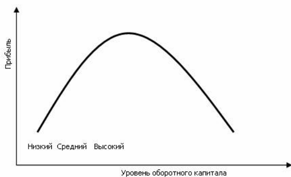
Рис. 1. Взаимосвязь прибыли и уровня оборотного капитала.

При низком уровне оборотного капитала производственная деятельность не поддерживается должным образом, отсюда – возможная потеря ликвидности, периодические сбои в работе и низкая прибыль. При некотором оптимальном уровне оборотного капитала прибыль становится максимальной. Дальнейшее повышение величины оборотных средств приведет к тому, что предприятие будет иметь в распоряжении временно свободные, бездействующие текущие активы, а также излишние издержки финансирования, что повлечет снижение прибыли (рис. 1) [2].