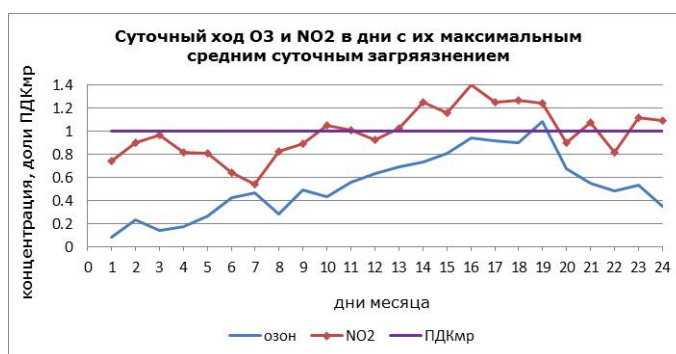
Рисунок 3 – Суточный ход n_{60} (доли ПДК мр ) для дней с максимальными в июне 2018 г. концентрациями NO 2 (14.06), O 3 (18.06)

и рассеивания примесей по высоте), а также значительного уменьшения выбросов вредных дымов за счет прекращения отопительного сезона, произошло устойчивое снижение концентраций всех фракций пыли, которые создавали исключительно сильное загрязнение атмосферы Бишкека зимой и в начале весны, ниже своих предельно допустимых как средних суточных, так и текущих разовых значений.