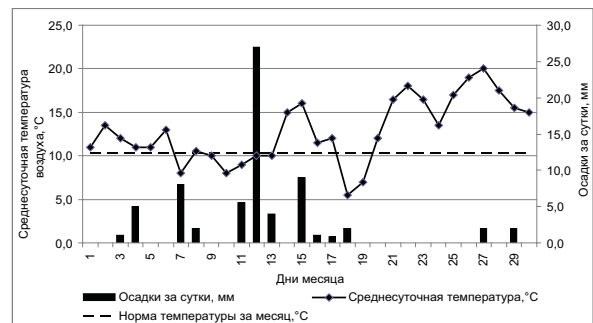
Рис. 2. Месячный ход температуры воздуха и осадков в Кара-Балте.