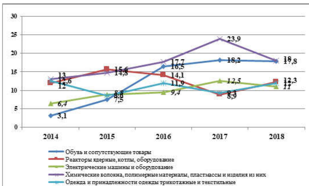
Рисунок 3 – Структура импорта КР из Турции (по разделам ТН ВЭД ЕАЭС)

Источник: Диаграмма составлена на основе данных НСК КР [2, 2019].