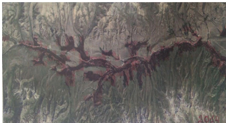
4 сүрөт – Суусамыр өрөөнүндөгү алтыгана бадалынын каптаган аянты 2014 - жыл. Болжолдуу эсептелген аянты \approx 48,5 \text{ км}^2 1 см: 1 км, 1:100000