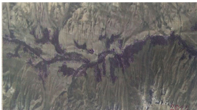
3 сүрөт – Суусамыр өрөөнүндөгү алтыгана бадалынын каптаган аянты 2012 - жыл. Болжолдуу эсептелген аянты \approx 48 \text{ км}^2 1 см: 1 км, 1:100000