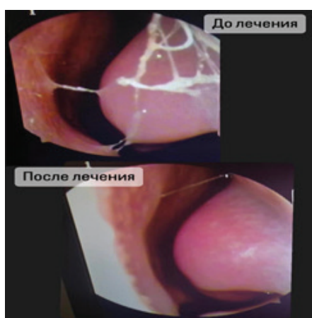
Рисунок 1 – Эндоскопическая картина полости носа (микрофото)