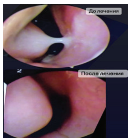
Рисунок 2 – Эндоскопическая картина полости носа (микрофото)