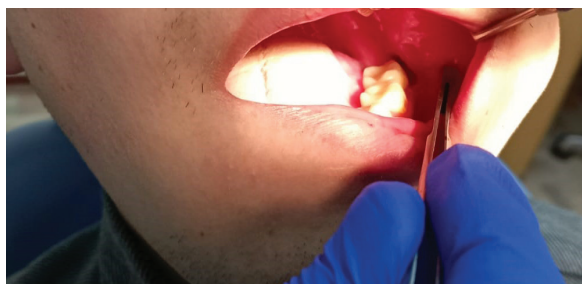
Рисунок 2 – Фото пациента К. на 5-е сутки после применения гемостатической губки с йодоформом и метилурациловой мазью

где применялась йодоформная турунда, заживление шло по пути образования грануляций из-за непосредственного раздражающего воздействия йодоформа, который вызывает рост грануляций. Сроки созревания грануляций отмечены не менее 2-х недель, а последующая эпителизация лунки занимает ещё срок до 10 дней, т. е. полное заживление лунки после альвеолита составляет не меньше месяца.