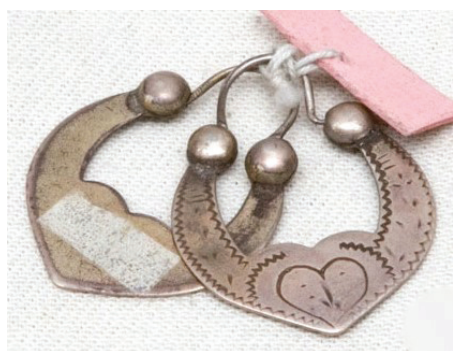
Рисунок 1 – Кольцевые серьги ай сырға . КП 6705-1162 КНМИИ им. Г. Айтиева