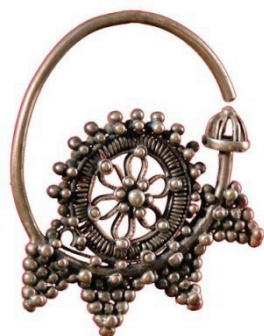
Рисунок 3 – Кольцевые серьги кашгар сырга (зере балдак). КП 5266-745 КНМИИ им. Г. Айтиева

Плоские серьги – жалтак сырга . Также как и объемные, их выковывали вместе с дужкой из цельного прута, но основу сплющивали, придавая ей геометрическую или фигурную форму. Иногда эту