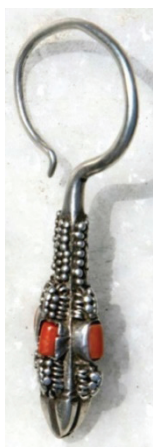
Рисунок 6 – Цельнокованные серьги көз койгон сырга . КП 15358-3387 КНММИИ им. Г. Айтиева