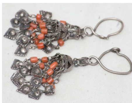
Рисунок 2 – Кольцевые серьги махмеди . КП 6707-1164 КНМИИ им. Г. Айтиева