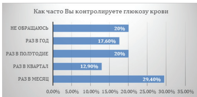
Рисунок 2 – Частота проверки глюкозы крови

нефролога, кардиолога) для профилактики осложнений, респонденты ответили следующим образом: «да» – 74,1 %, «нет» – 25,9 %.