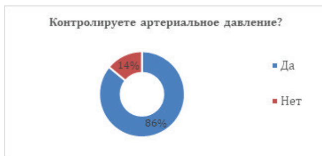
Рисунок 3 – Контроль АД